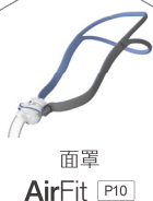
面罩 AirFit P10