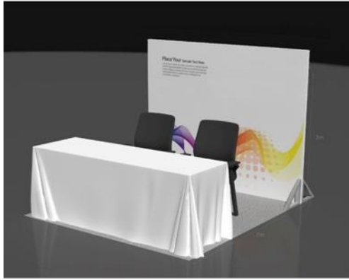
线下 - 标准展位示意图